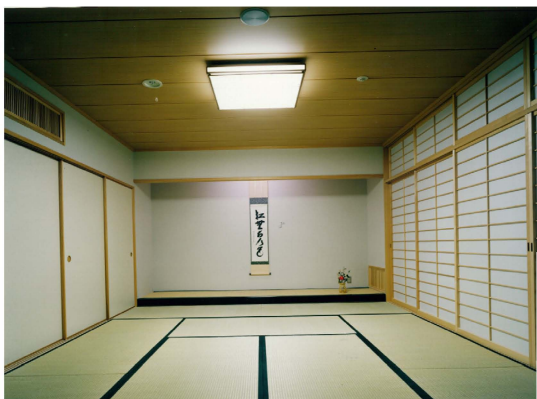
〔和室〕 書道・華道など