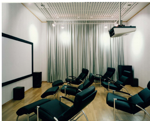
〔AVルーム〕 ビデオ鑑賞など