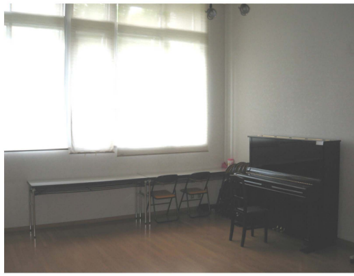
〔音楽室〕 楽器練習など