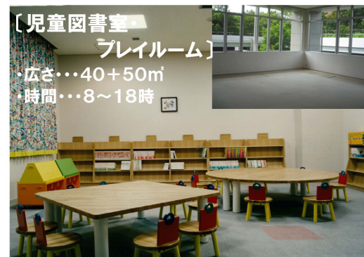
〔児童図書室・ ブレイルーム〕