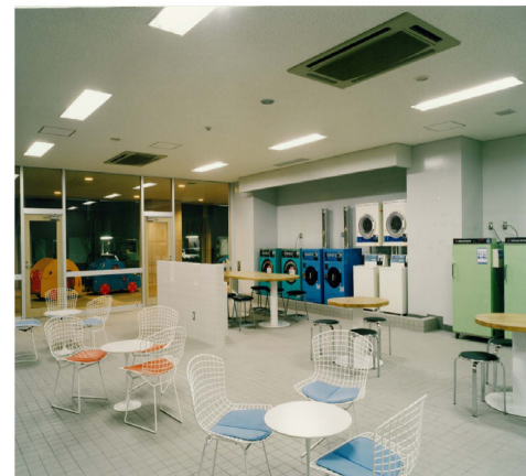
〔ランドリールーム〕