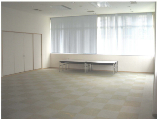
〔コミュニティホール〕 2階 会議室 (大)